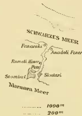
Fig. 3. Tiefenlinien im Schwarzen Meer an der Bosphorusmündung (nach Berghaus)

So bestechend die gesamten Ausführungen English's durch die Klarheit ihrer Darlegungen auch sind, können sie doch nicht ohne weiteres angenommen werden. Ich möchte ihnen nur hinsichtlich der Eintiefung des Bosphorus durch ein nordöstlich fließendes Gewässer unbedingt beipflichten. Es läßt sich auch außer den Kolken im Bosphorus und den allgemeinen Verhältnissen des Gefälles in demselben noch ein weiteres Argument für diese Annahme anführen, die Tatsache nämlich, daß auf dem Grunde des Schwarzen Meeres nächst der Mündung des Bosphorus Tiefenverhältnisse vorhanden sind, welche andeuten, daß die Flußrinne noch ein Stück auf dem Grunde des Meeres zu verfolgen ist. Ich kann dies allerdings nur aus einem ungenügenden Beweismaterial ableiten, da mir eine Tiefenkarte des Schwarzen Meeres mit genaueren Angaben in Graz nicht zugänglich war; doch zeigt die Karte 24 des Berghaus'schen Physikalischen Atlases (Mitteländisches und Schwarzes Meer) sehr bezeichnende Einbiegungen der Tiefenlinie von 200 m , welche sich dem Bosphorus zukehren, während die Tiefenlinie von 1000 m keinerlei Störung erkennen läßt (Fig. 3). Wenn — wie ich mit gutem Grund annehmen darf — in der Tat Furchen auf dem Grunde des Schwarzen Meeres vorhanden sind, welche als Verlängerung des Bosphorustales betrachtet werden können, so sind sie gewiß nicht durch die heutige untere Strömung salzigeren Wassers verursacht worden, zumal diese ihre Wirkung kaum bis zu einer Tiefe